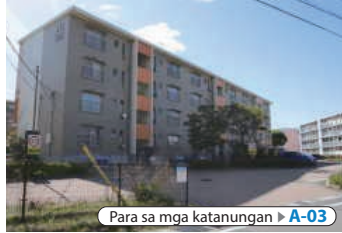
Para sa mga katanungan ▶ A-03