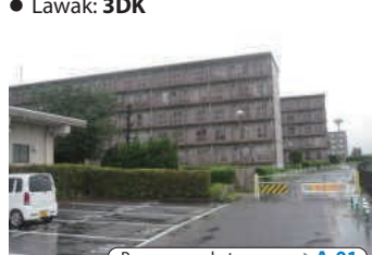
Para sa mga katanungan ▶ A-01