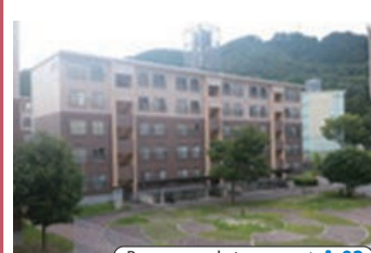
Para sa mga katanungan ▶ A-02