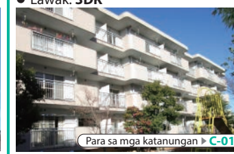
Para sa mga katanungan ▶ C-01