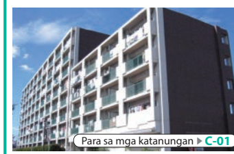
Para sa mga katanungan ▶ C-01