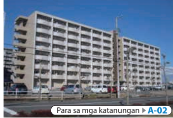
Para sa mga katanungan ▶ A-02