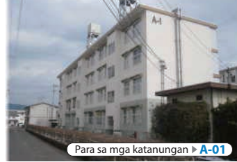
Para sa mga katanungan ▶ A-01

📄 Paki-check dito tungkol sa halaga ng renta sa mga pabahay ng prepektura