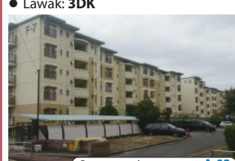
Para sa mga katanungan ▶ A-02