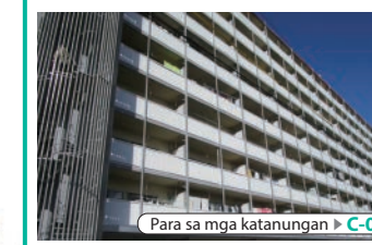
Para sa mga katanungan ▶ C-01