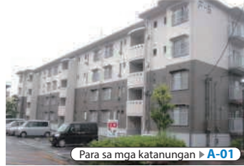
Para sa mga katanungan ▶ A-01