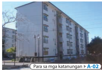
Para sa mga katanungan ▶ A-02