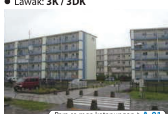
Para sa mga katanungan ▶ A-01