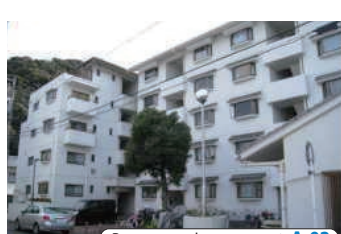
Para sa mga katanungan ▶ A-02