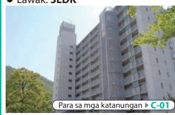
Para sa mga katanungan ▶ C-01