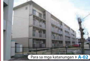
Para sa mga katanungan ▶ A-02