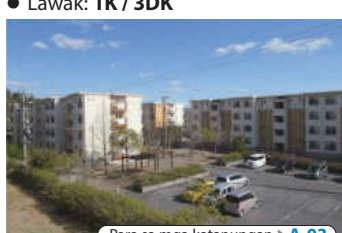
Para sa mga katanungan ▶ A-03